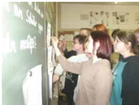
Ausbildung der Schülermoderatoren.

Eine erste Reflexion des Vormittages zeigte, dass alle Beteiligten den Austausch über Missverständnisse im Miteinander als sehr notwendig empfanden und über den offenen und ehrlichen Diskurs angenehm überrascht waren.