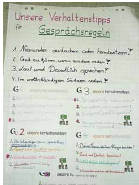
Arbeitsergebnisse Klasse 7.

Dass die Lehrer an diesem Vormittag kaum in Erscheinung traten, wirkte sich positiv auf die anschließende Erarbeitung gemeinsamer Regeln im Klassenraum aus, da die Schüler sie als „ihre eigenen“ Vereinbarungen (auch in der Formulierung!) erarbeiteten.