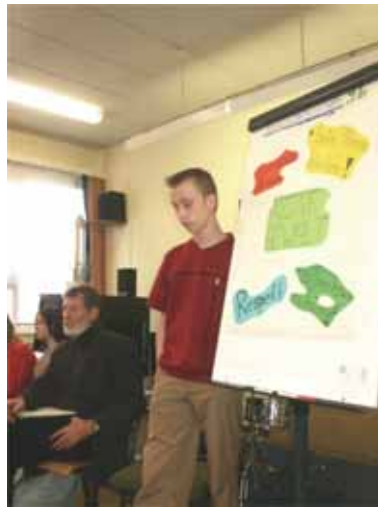
Präsentation der Klassenergebnisse eines Schülers.

Dabei wurde folgender Konsens erarbeitet: