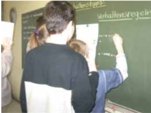
Arbeit an den Klassenregeln.